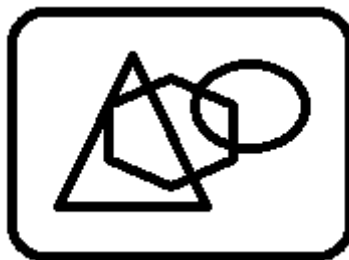
Рис. 1. Название рисунка

Таблицы, рисунки, схемы, графики должны быть пронумерованы и озаглавлены. Все рисунки должны быть четкими – 300 dpi в формате tif или jpg. Например: